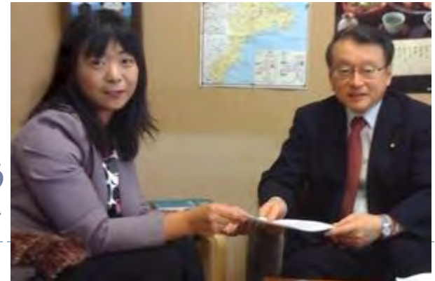
右写真:高校無償化で 朝鮮学校を除外しないよう 中川文部科学大臣に要請