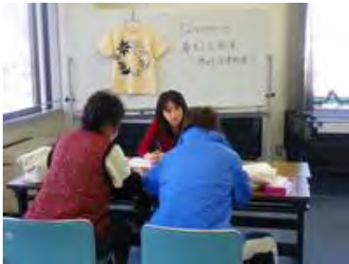
←左写真: 岩手県・大船渡での 無料法律相談