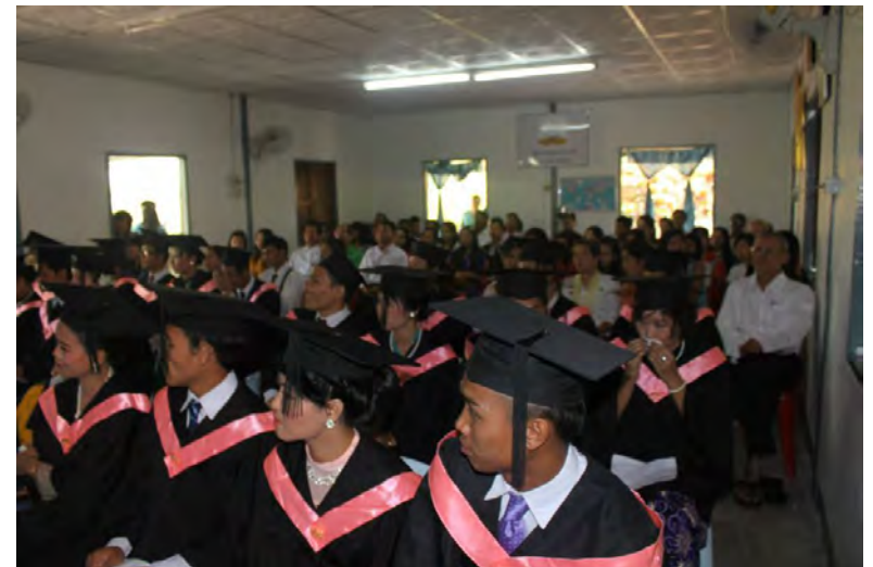
写真:ヒューマンライツ・ナウが 2009~2013年まで運営支援をしてきた、 ミャンマーの次世代リーダーに 人権教育をする「ピースローアカデミー」 卒業式の様子。 卒業生の多くはいま、ミャンマーへ戻り、 民主化の最前線で活躍中です。