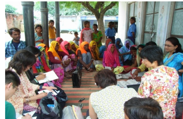
写真 HRN:2009年インド調査より