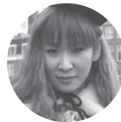
雨宮処凛 作家、活動家

◆WEB http://www.huruim.com/contents.html