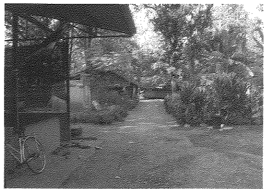
NEWDAY PRIMARY SCHOOL