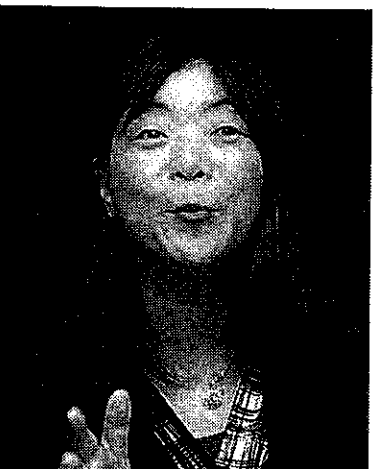
伊藤和子氏(いとう・かずこ) 東京都生まれ。国際人権団体ヒューマンライツ・ナウ事務局長。著書に「人権は国境を越えて」など。